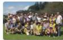
東日本大震災復興支援茶室ツアー