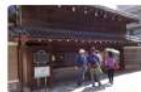
足立区内まち歩き