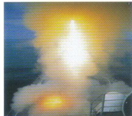
垂直式短SAM発射装置 (VLS for Short Range SAM) 対空目標に対処するため短距離射程の対空ミサイルを発射する装置です。