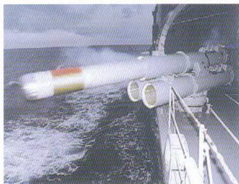
3連装短魚雷発射管 (Torpedo Tubes) 潜水艦攻撃用の短魚雷を圧縮空気で発射する装置です。