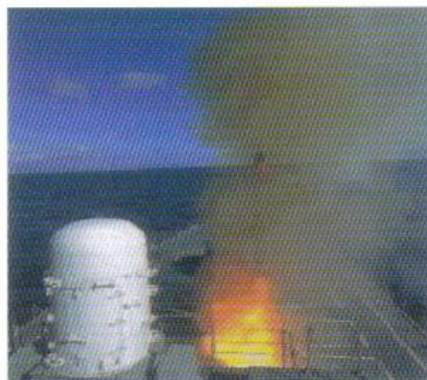
垂直式アスロック発射装置 (VLS for Anti Submarine Rocket) 潜水艦攻撃用の魚雷を遠距離に飛ばすため、魚雷の後部にブースターロケットを装着して発射する装置です。